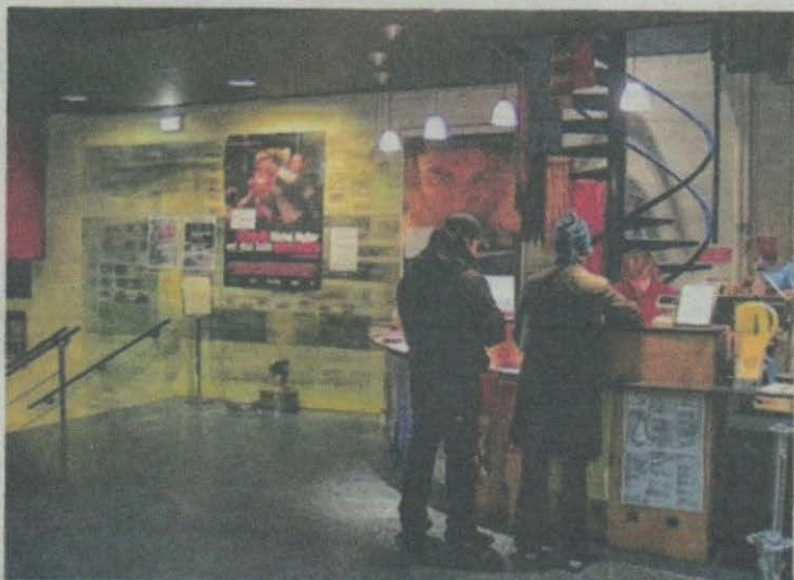
Montreuil. Quelques mois avant le déménagement du cinéma dans ses salles neuves, une nouvelle crise secoue le Méliès. (L.P.B.S.)

Au cabinet de la maire, on martèle qu'« il est avéré que l'argent de cette deuxième caisse n'est jamais rentré dans la comptabilité municipale : sinon il n'y aurait pas de sujet ». La ville explique que 1 800 € en liquide (NDLR : et non 18 000 € comme écrit par erreur) ont été retrouvés dans des armoires, donc en dehors de la caisse